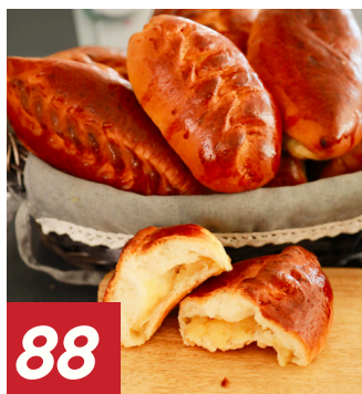
Sotschni Teigtaschen mit Quarkfüllung